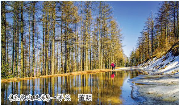
《鹿泉沟风光》一等奖 董明