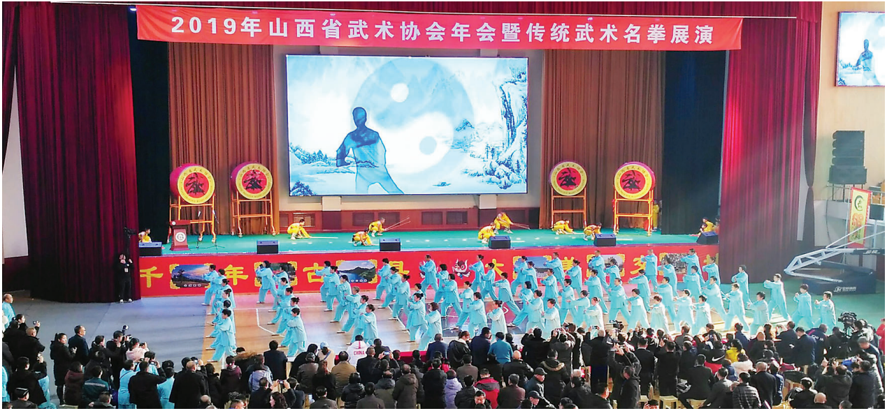
近日,2019年山西省武术协会年会暨传统武术名拳展演在交城县举行,来自全省各地市的武术团体单位共252人参加了此次武术展演,此次展演活动将我省各个地方拳种汇聚一堂,进一步促进我省武术传统文化传承与发展。图为交城县武术协会24式太极拳展演。