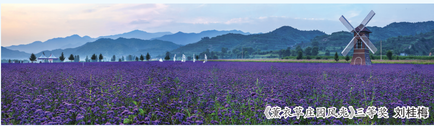
《寂寂平庄园风光》三等奖 刘桂梅