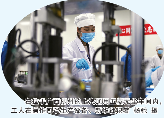
在位于广西柳州的上汽通用五菱生产车间内，工人在操作回罩生产设备。