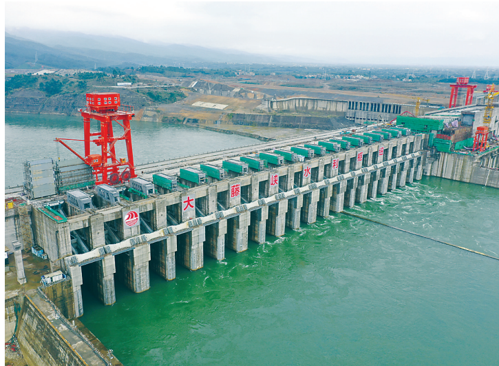
图为建设中的大藤峡水利枢纽工程(2月14日摄，无人机照片)。