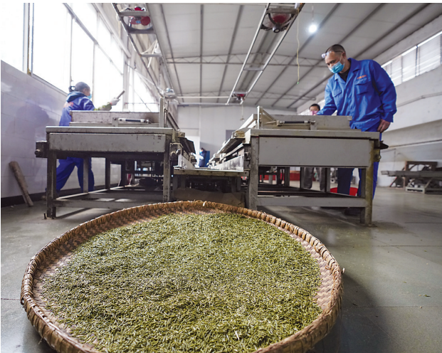
2月23日，在南川区兴隆茶场的制茶车间内，复工的工人们在制作春茶。

连日来，随着气温不断回升，重庆市南川区的早春茶抽出嫩芽，陆续进入采摘期。当地茶厂在做好新冠肺炎疫情防控的同时，陆续开始复工采摘制作第一批春茶。