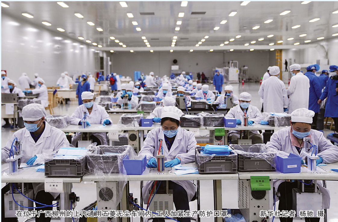
在位于广西柳州的上汽通用五菱生产车间内，工人加紧生产防护口罩。