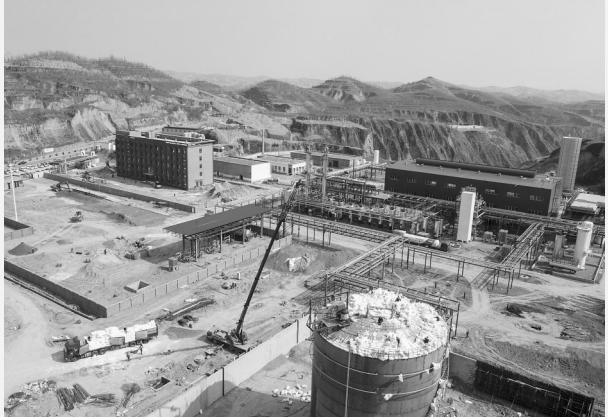
非常规天然气液化调峰项目施工现场