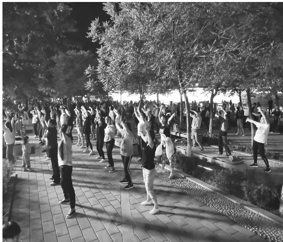
5月27日,市民在市区北川河文化广场练舞。晚饭后,广场舞跳起来,秧歌扭起来,现在居民的文体生活越来越丰富多彩。