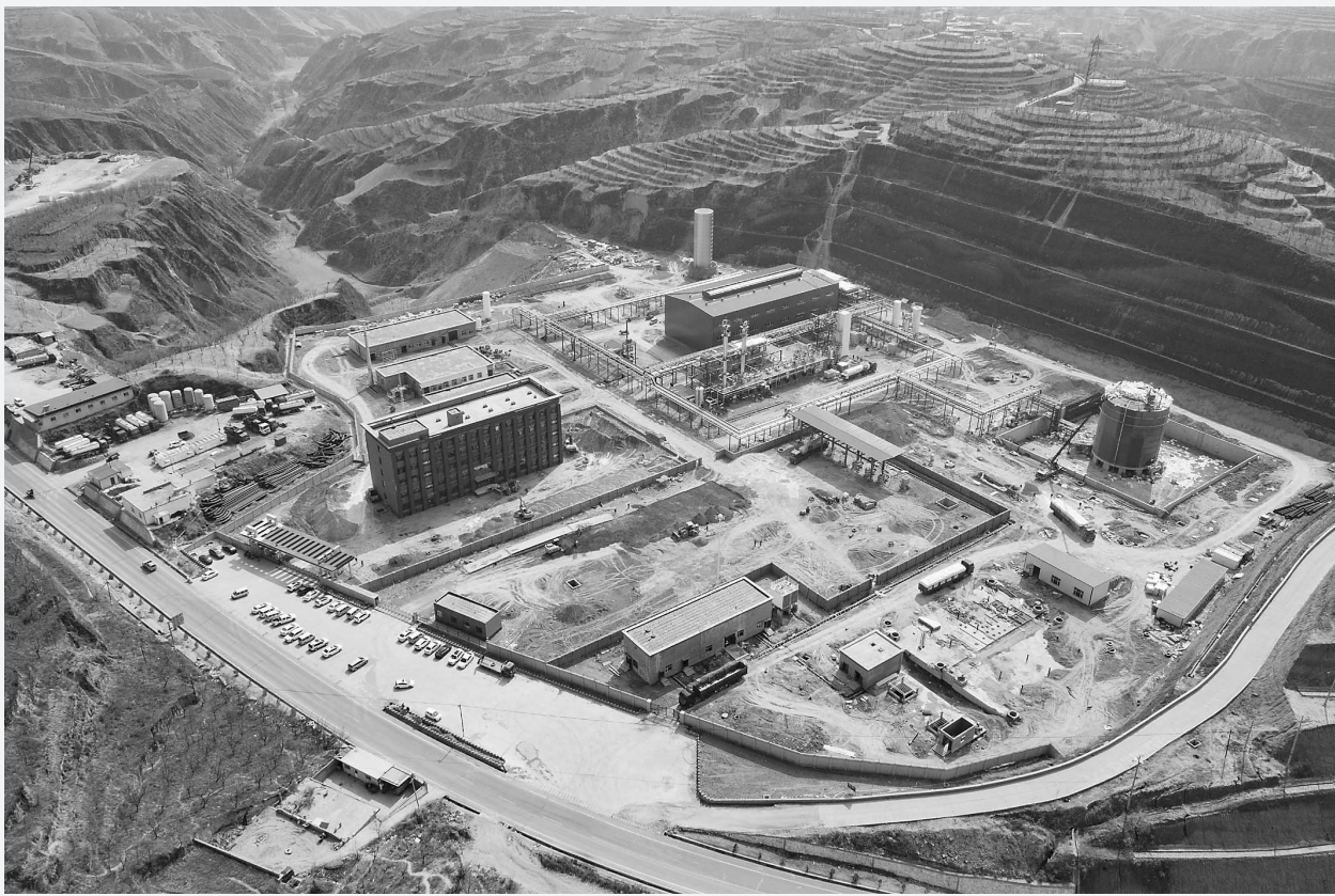
无人机拍摄的山西天浩清洁能源有限公司非常规天然气液化调峰项目施工现场