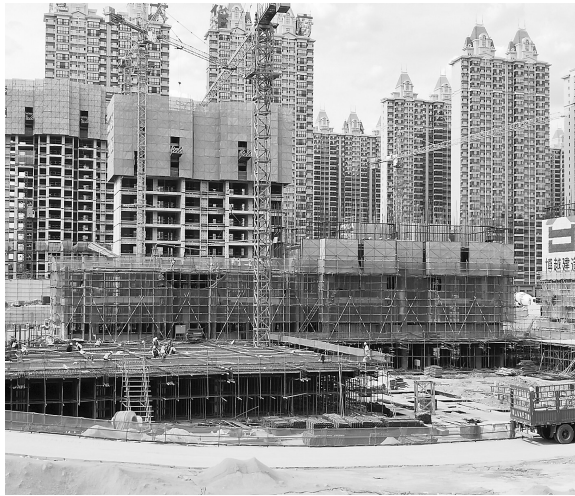
连日来的吕梁市各地多措并举,按下复工复产“快进键”,全力推进企业顺利生产、项目快速发展。

该行负责人表示,将继续充分发挥金融科技优势,突破物理网点的局限,持续创新推动电子营业执照在金融领域的融合创新,逐步实现出示即可办理信贷、产品签约、商户核验等业务。