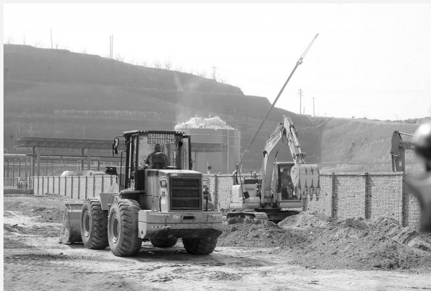
非常规天然气液化调峰项目施工现场