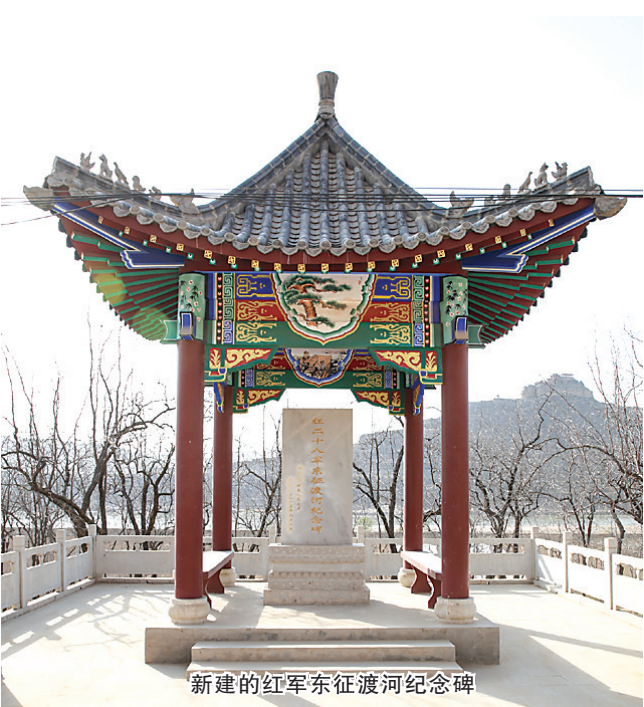
新建的红军东征渡河纪念碑