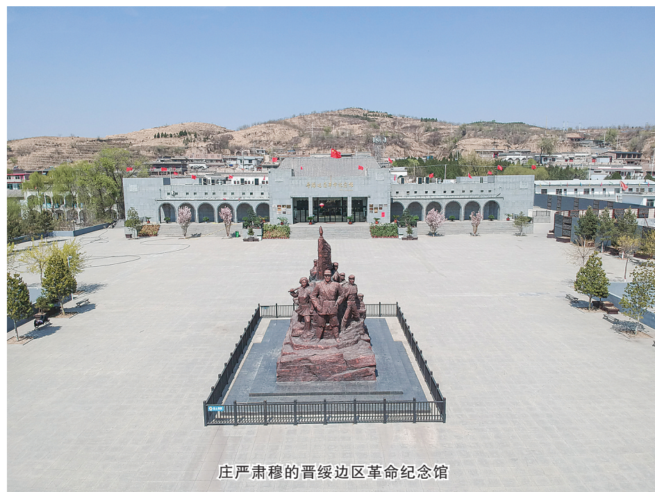
庄严肃穆的晋绥边区革命纪念馆

兴县位于我市最北端,是黄河流经吕梁的第一站。作为晋绥边区首府,兴县有着丰厚的历史文化积淀,这里有着全市最大的县域版图,也有已探明的煤炭、铝土矿、煤层气等23种矿产资源。脱贫致富,是世代面朝黄土背朝天的兴县农民殷切期盼的中国梦。