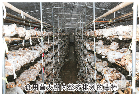
食用菌大棚内整齐排列的菌棒