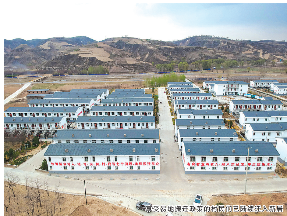
享受易地搬迁政策的村民们已陆续迁入新居