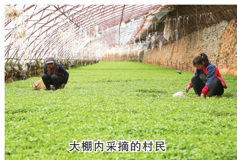
大棚内采摘的村民