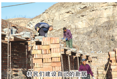
村民们建设自己的新居