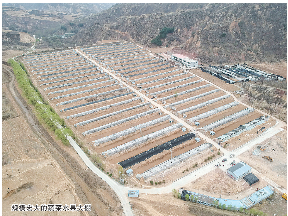
规模宏大的蔬菜水果大棚