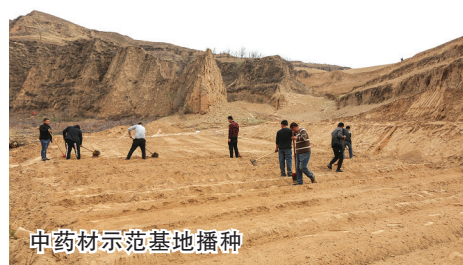
中药材示范基地播种