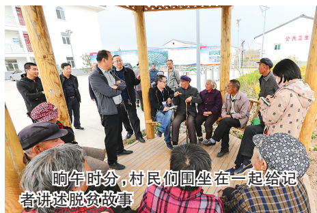
晌午时分,村民们围坐在一起给记者讲述脱贫故事