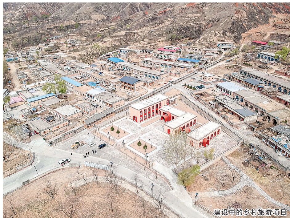
建设中的乡村旅游项目

在去往后北会村的路上,我们看到了两位耄耋老人坐在黄河边,旁边的石台上放置着一副望远镜。当记者问道您两位用望远镜在看什么的时候,老人笑着说:“在看黄河呀!”是的,老人们看到的是黄河岸边日新月异的变化,是兴县脱贫致富的成果。