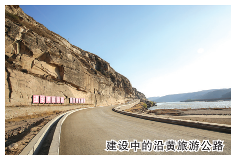
建设中的沿黄旅游公路