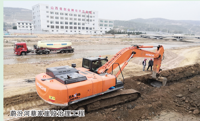
蔚汾河蔡家崖段治理工程