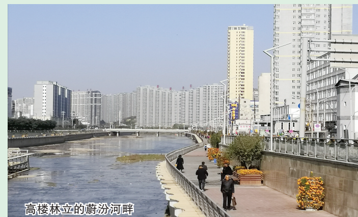
高楼林立的蔚汾河畔

近年来,兴县坚持把城乡基础设施建设作为提高民生福祉的重要工作,紧紧抓在手上,落在行动上,以前所未有的力度,铺开了城区美化、亮化、净化、绿化、细化等一系列民生工程和城乡环境整治行动,城区面貌得到明显改善,城市品位进一步提升,人民群众的居住环境得到很大改善。