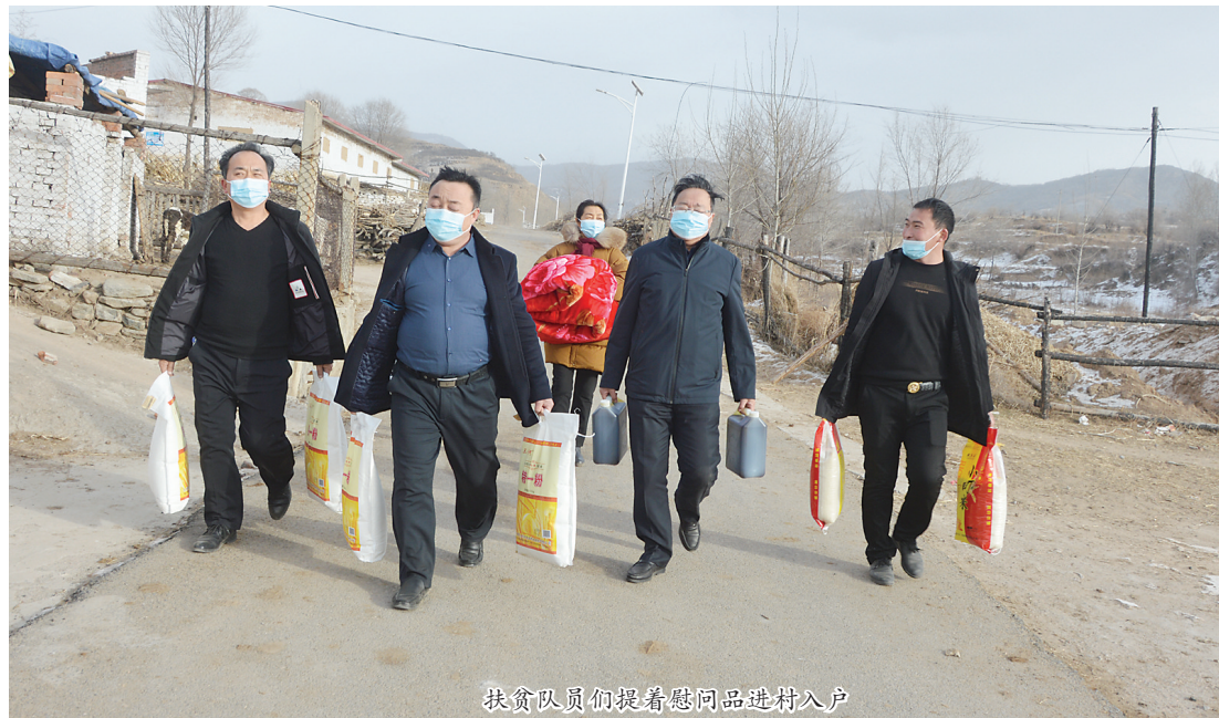
扶贫队员们提着慰问品进村入户

春节临近，市区的街头上已经悄悄地挂上了各种各样的彩灯，大街小巷喜气洋洋、绚丽多彩，到处弥漫着新年的气息。