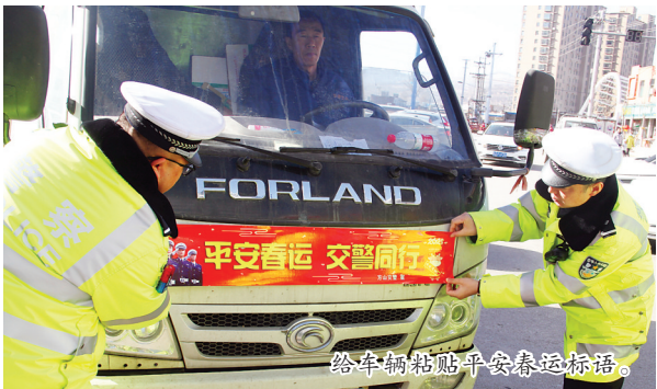
给车辆张贴平安春运标语。

1月28日，春运第一天，方山县公安局交警大队客运中队组织民警深入该县汽车站开展春运交通安全宣传，提高广大交通参与者的安全意识、守法意识，进一步增强源头管理，有效预防和减少交通事故的发生。