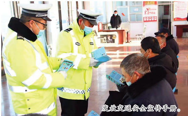
发放交通安全宣传手册。