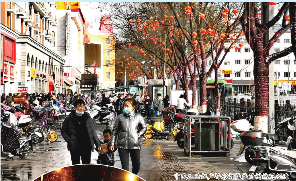
市民从世纪广场彩灯装饰的树林下经过