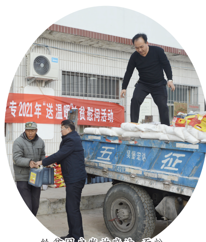
给贫困户发放原粮、面粉