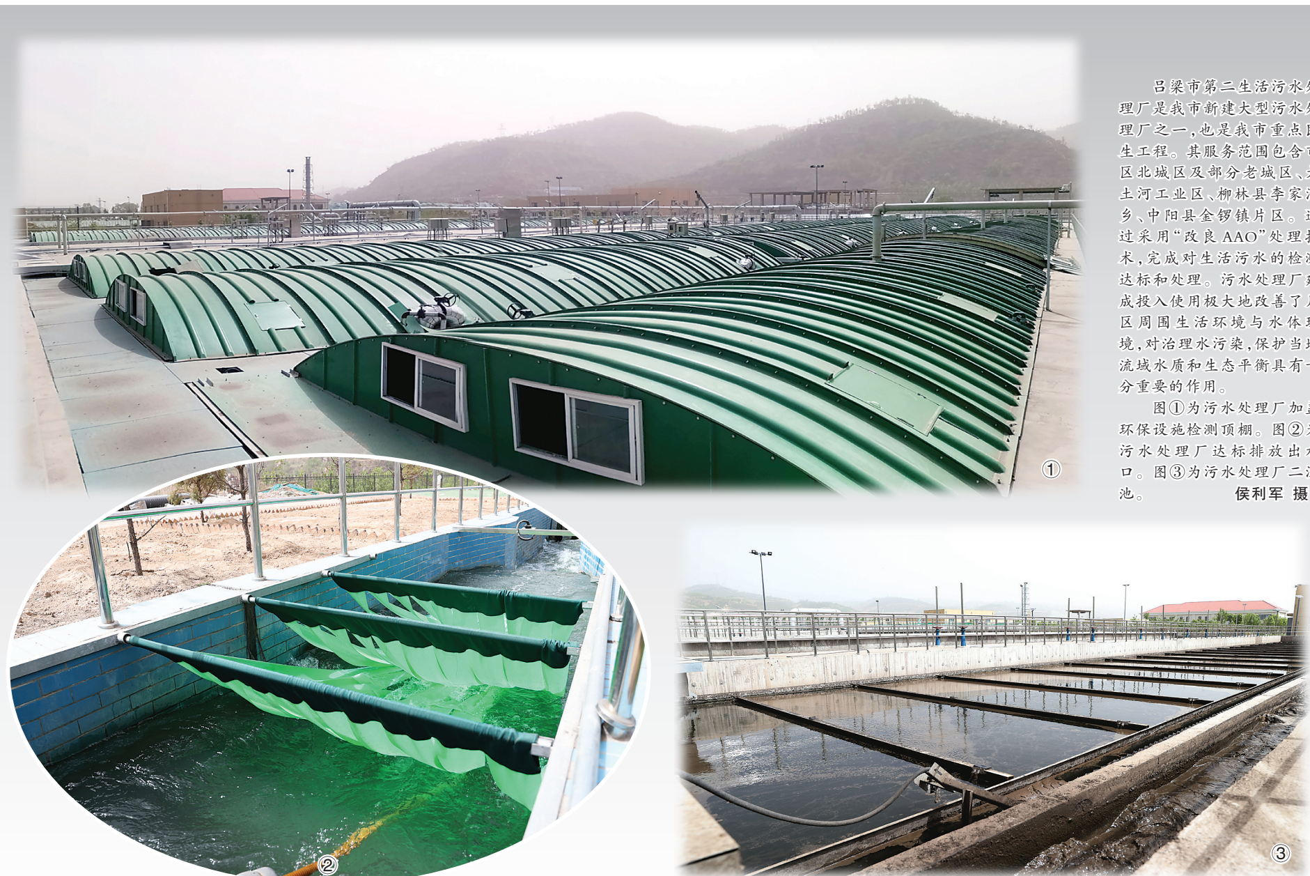
吕梁市第二生活污水处理厂是我市新建大型污水处理厂之一,也是我市重点民生工程。其服务范围包含市区北城区及部分老城区、大土河工业区、柳林县李家湾乡、中阳县金罗镇片区。通过采用“改良AAO”处理技术,完成对生活污水的检测达标和处理。污水处理厂建成投入使用极大地改善了片区周围生活环境与水体环境,对治理水污染,保护当地流域水质和生态平衡具有十分重要的作用。