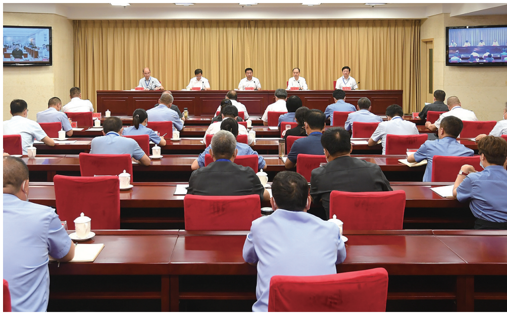
图为吕梁市政法队伍教育整顿总结大会会场。

市教育整顿领导小组及办公室成员在主会场参会，各县市区教育整顿领导小组及办公室成员在分会场参会。