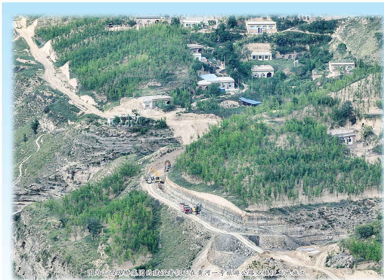
图为山西路桥集团的建设者们正在黄河一号旅游公路石楼段工地施工。

余吨,提供优质的白酒和肉鸡饲养原料,玉米秸秆成为当地养殖的重要饲料来源。打造酿酒企业1户,年产生酒糟20余万吨,可解决4万余头牛的饲料需求。全镇肉牛存栏51万余头,肉鸡存栏达到69.3万只。大