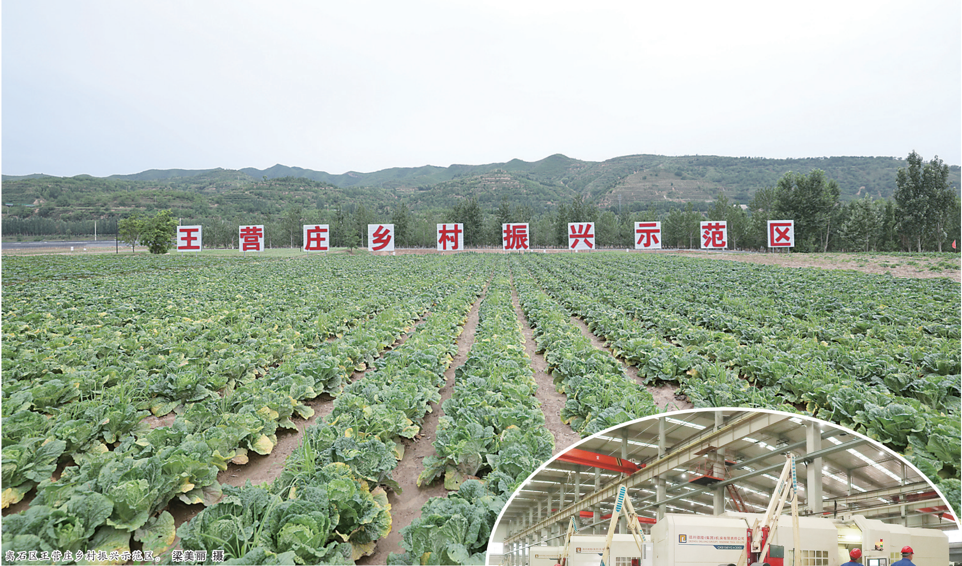
离石区王营庄乡村振兴示范区。

今年以来,离石区坚持以习近平新时代中国特色社会主义思想为指导,深入学习贯彻习近平总书记视察山西重要讲话重要指示,坚持稳中求进工作总基调,统筹做好经济发展、重点项目建设、文明城市创建等民生福祉,为离石区经济发展保持稳中向好、稳中有进的态势注入动能,令石州大地激越振奋。