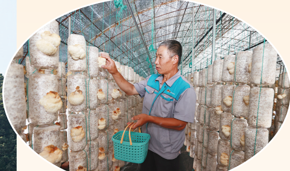
图为大棚内农技师傅正在采摘长势好的猴头菇产品。

中阳县心言黑木耳产业发展综合园区是山西省农业转型标杆项目,位于暖泉镇关上、河底、刘家坪村等地,对该县农业转型、乡村振兴、农民稳定增收有着重要的意义。