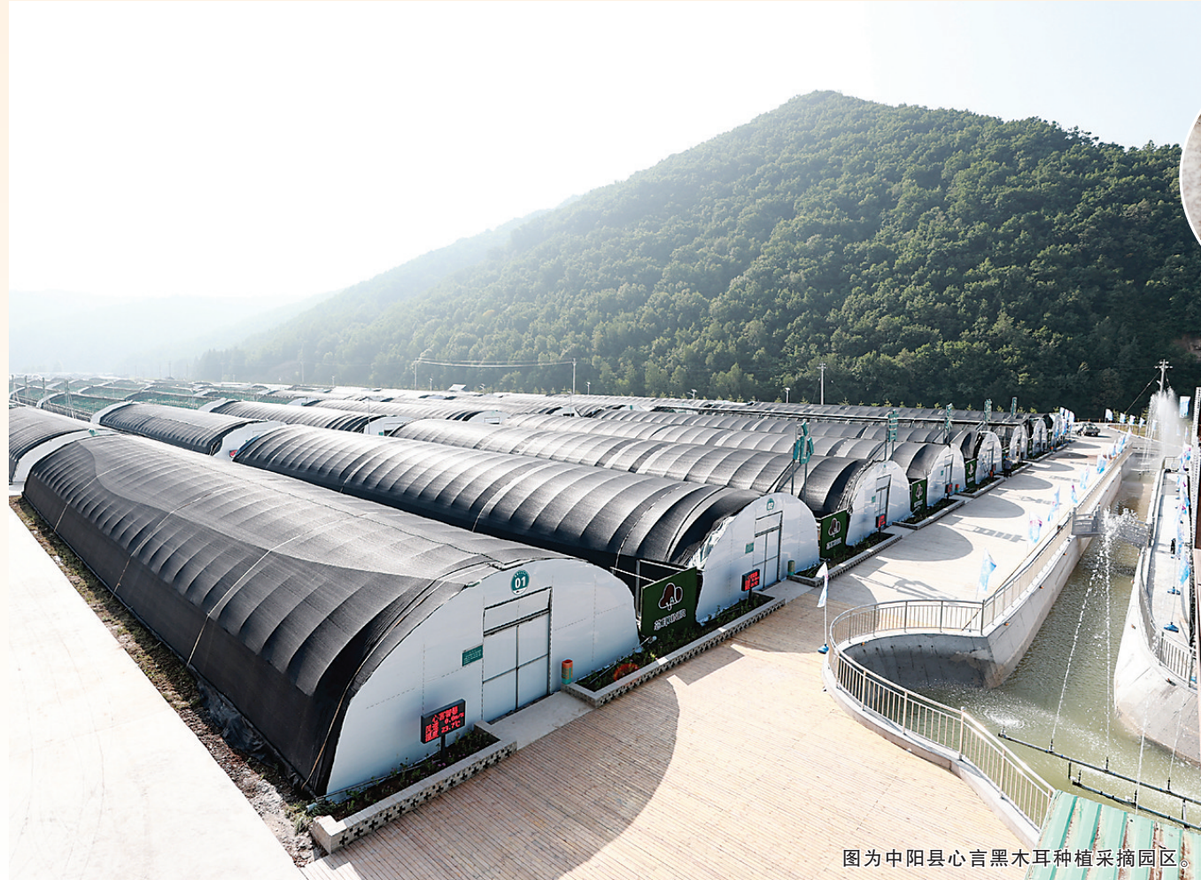
图为中阳县心言黑木耳种植采摘园区

接下来,该公司将持续走访企业客户,“一对一”满足用电需求。在做好高温保供的同时,积极备战防汛工作,及时明确保供重点,切实提升应对暴雨等极端天气下电网突发事件的应急响应能力及事故处置能力。扎实开展电网设备安全检查、测温、巡视,实时掌握电网设备运行状况,做实、做细各项工