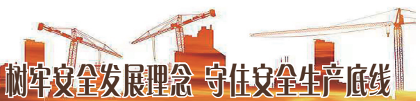
树牢安全发展理念 守住安全生产底线