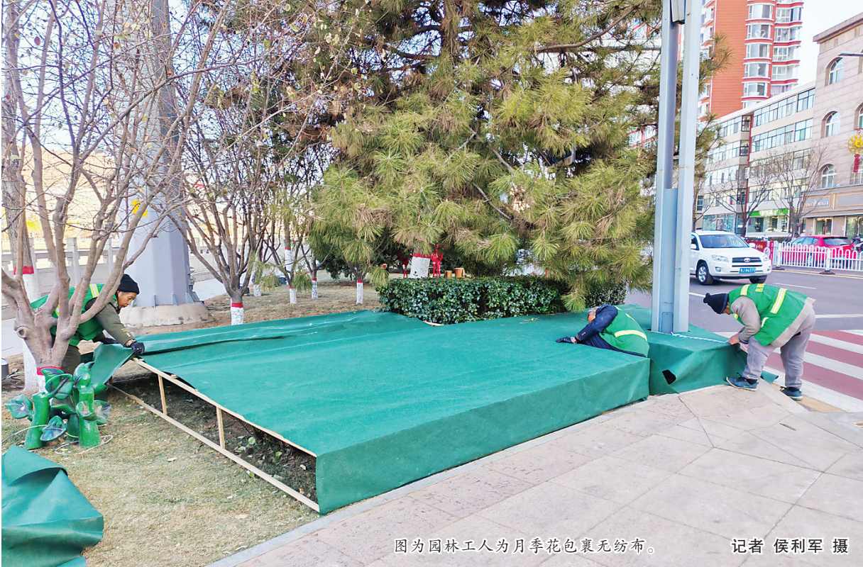
图为园林工人为月季花包裹无纺布。

据了解,吕梁油库位于山西省孝义市梧桐镇东董屯村村东,占地面积174.84亩,总库容7.6万立方米,主要承担着吕梁市周边14个市(县)石油成品油供应任务,最大服务半径达245公里,是全市库容规模最大、吞吐能力最强、设备最先进、配套最完善的国家二级油库。