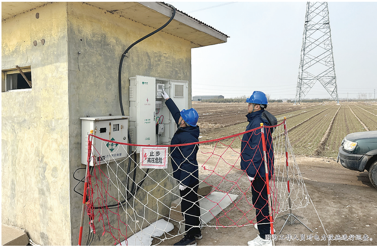
图为工作人员对电力设施进行巡检。

此外,抓好督导检查,充分发挥各级指挥部办公室牵头抓总和各成员单位各负其责作用,加强协作配合,联合开展检查。按照“四不两直”要求,在清明、五一前后对各地进行明察暗访,对检查中发现问题要做到即查即改、立行立改。要严肃依法治火,以“零容忍”的态度对林区野外违法违规用火行为进行重点整治,加大打击力度,严惩重处。严格落实《吕梁市森林草原火情管控奖惩办法(试行)》,形成违法必究、有责必担的高压态势,全力筑牢森林草原防火“安全墙”。