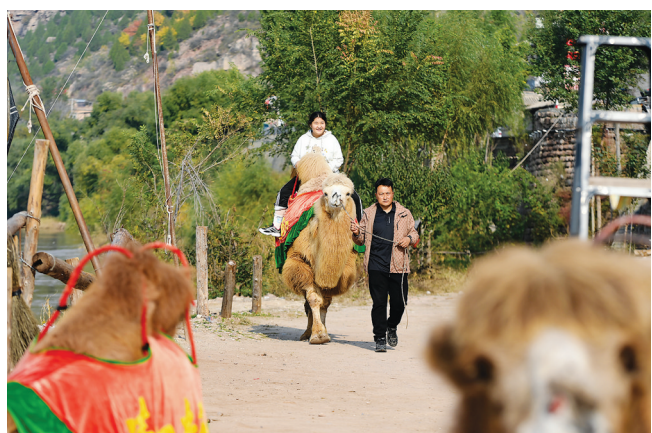
在临县碛口古镇,一位游客在骑骆驼。