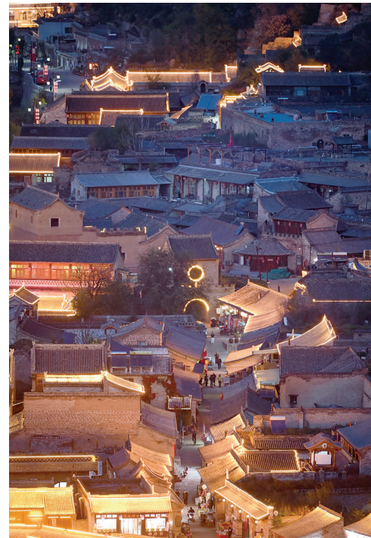
临县碛口古镇夜景一角。