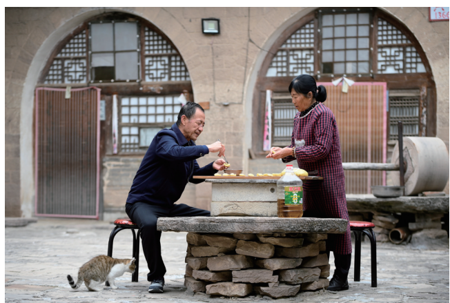
在临县碛口古镇,村民在院子里做油糕。