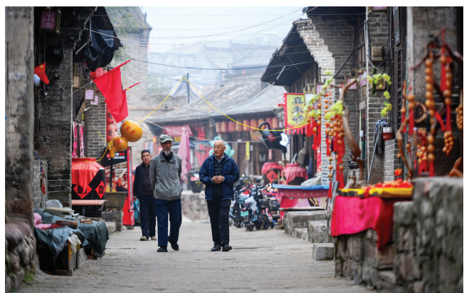
人们行走在碛口古镇街道上。