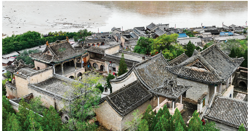
临县碛口古镇一角(无人机照片)。

如今,碛口有各类民宿客栈、农家乐40余家,旅游商品经营户120余家,旅游行业从业人员达5000余人,年接待游客量突破百万人次。这座古镇再度兴盛,成长为国家4A级旅游景区,吸引各地游客前来领略“九曲黄河第一镇”的魅力。