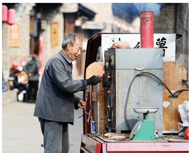
临县碛口古镇,商贩查看烤红薯成熟度。