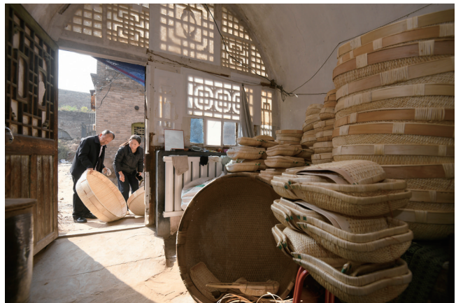
在临县碛口古镇,店家(右)向顾客介绍自己制作的柳编制品。