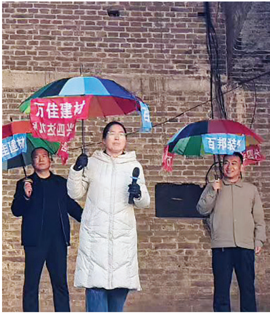
图为临县伞秧歌队现场演出。近日，吕梁日报社驻临县招贤镇立新庄村和小塔则村工作队主动对接、奔走协调，积极促成吕梁市民政局、吕梁市慈善总会“慈善暖吕梁 五进润民心”活动走进村里，开展文艺慰问、文化宣讲等活动，并为两村日照照料中心各拨付慰问金5000元，精准传递慈善暖意。

“生命至上，安全第一”不是一句口号，而是体现在每一条畅通的消防通道上。从社区倾听诉求、主动参与，到部门联动执法、常态监管，再到群众主动作为、自觉守护，唯有全社会形成合力，才能彻底破解消防通道堵塞难题，让“生命通道”真正成为群众安全的“守护者”。