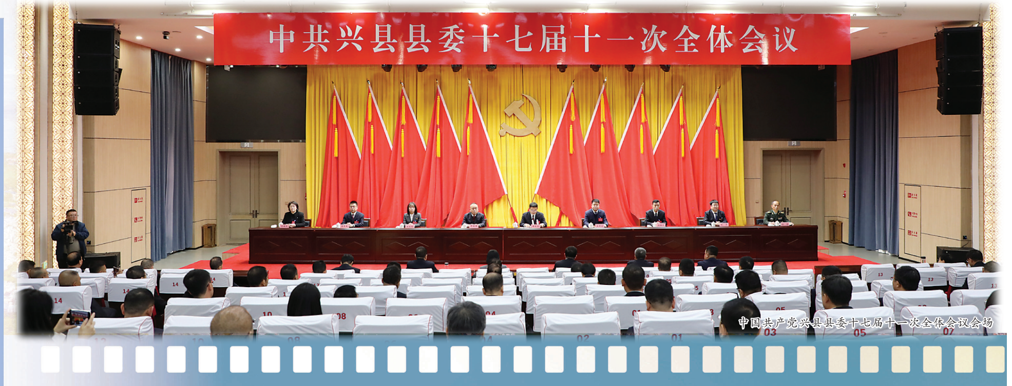
中国共产党兴县县委十七届十一次全体会议会场