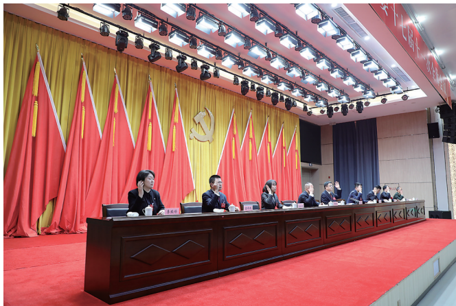
会议表决通过兴县“十五五”规划建议

瑞雪消融处,春潮涌动时。兴县儿女正以更加饱满的热情、更加昂扬的斗志、更加充足的干劲,砥砺团结奋斗之初心,激扬创新进取之精神,顽强拼搏、真抓实干,不断在新征程上赢得主动、赢得优势,切实把全会擘画的宏伟蓝图转化为推动兴县高质量发展的生动实践,奋力谱写中国式现代化兴县新篇章。