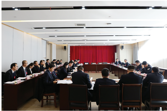
与会代表分组讨论