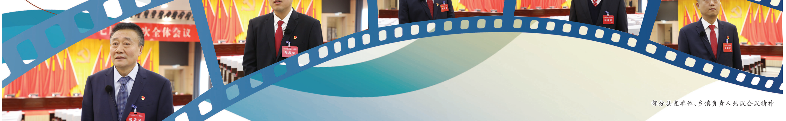
部分县直单位、乡镇负责人热议会议精神