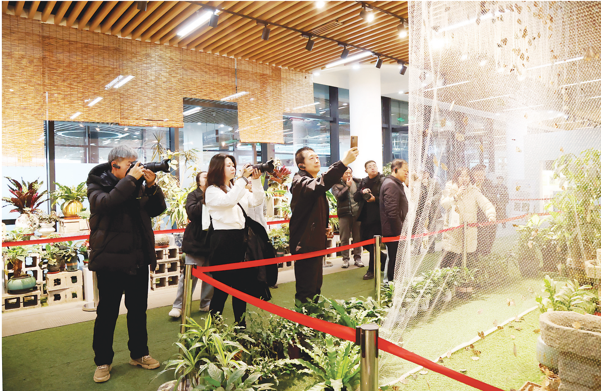
翩跹飞舞的蝴蝶吸引了摄影老师们的镜头