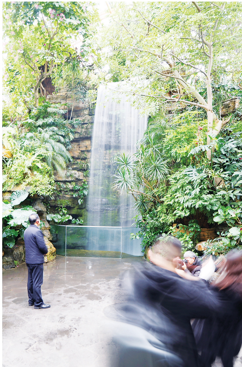
热带植物馆内的网红打卡瀑布

雪落无声,镜中有痕;联盟之约,山海共赴。这场始于冰雪、归于生机的收官采风,是一个诗意的句读,更一声悠长的序曲——预示着当春风再度拂过三晋大地,这支已然淬炼成型的视觉尖兵,必将以更默契的协同、更深刻的视角,继续描绘中部崛起征程上,那更加波澜壮阔的春天画卷。