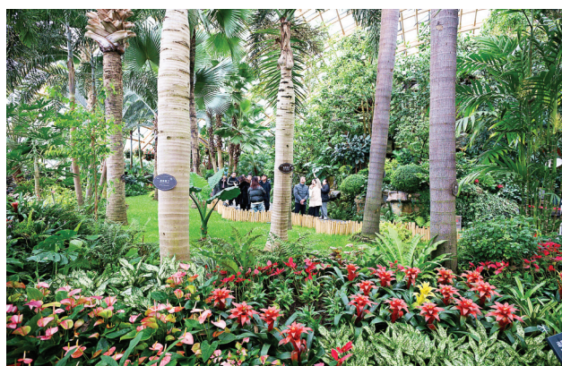
热带植物馆内生机勃勃