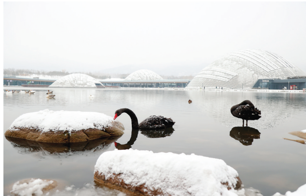
雪中盛景