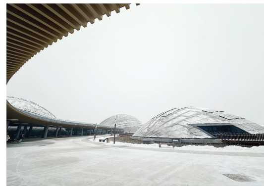
雪落穹顶