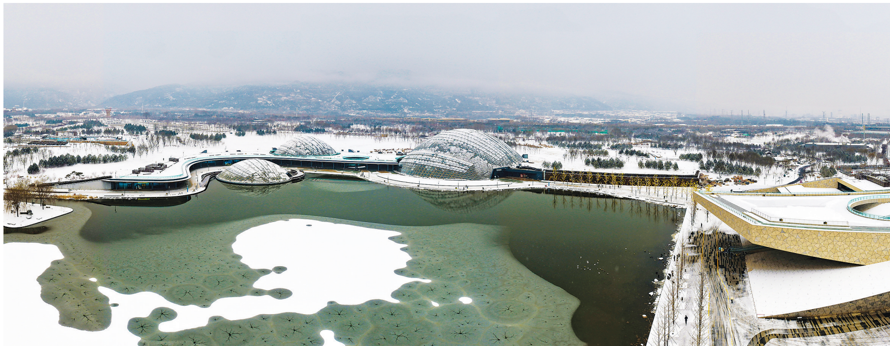
银装素裹下的太原植物园