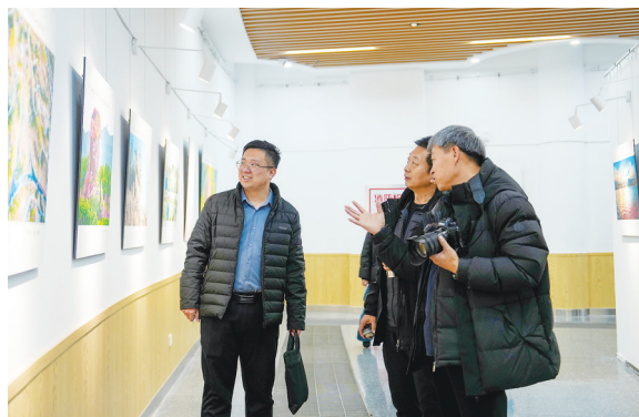
交流品鉴摄影作品