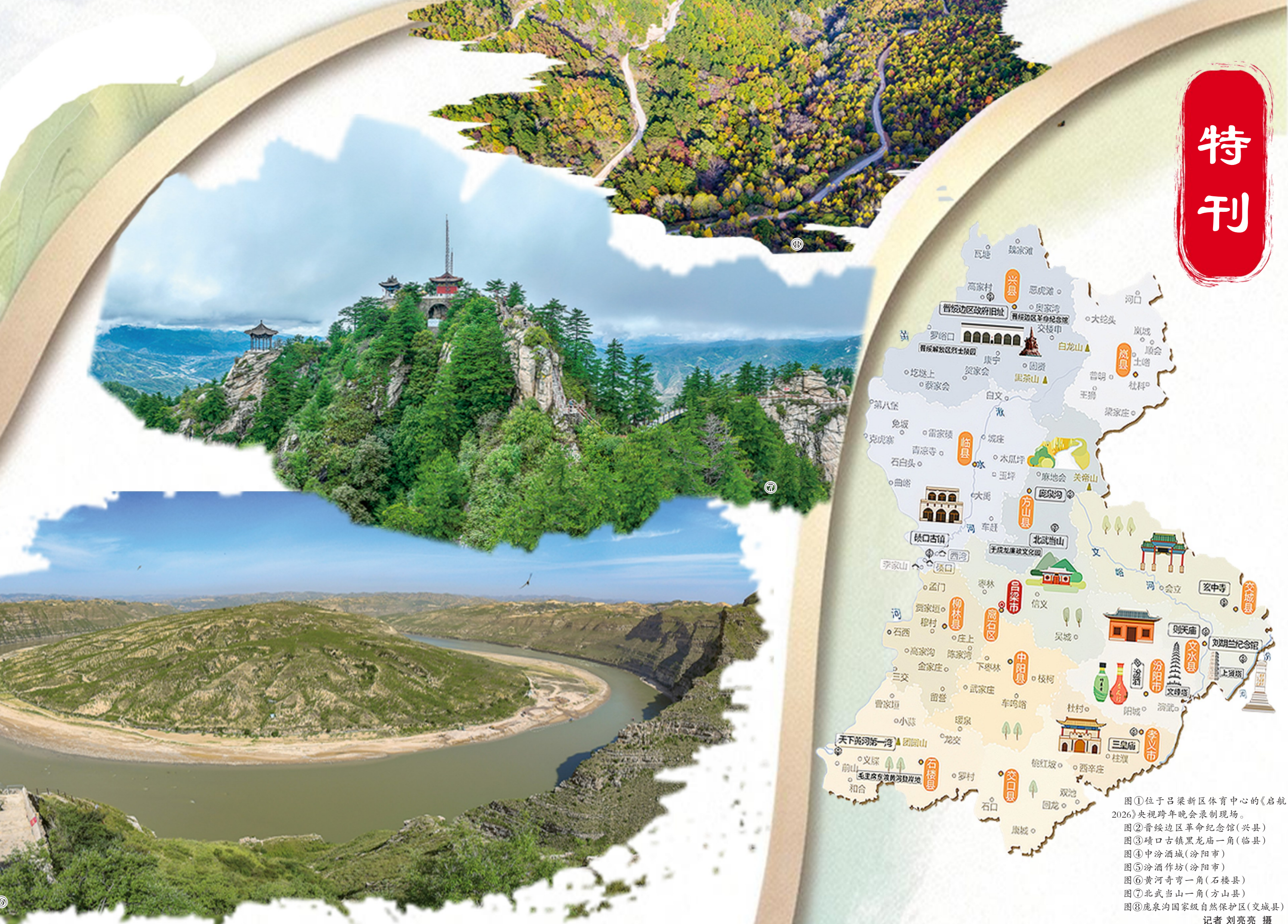
图①位于吕梁新区体育中心的《启航2026》央视跨年晚会主会场 图②晋绥边区革命纪念馆(兴县) 图③碛口古镇龙窟一角(临县) 图④中汾酒城(汾阳市) 图⑤汾酒作坊坊(汾阳市) 图⑥黄河奇角一角(石楼县) 图⑦北武当山一角(方山县) 图⑧庞泉沟国家级自然保护区(交城县)