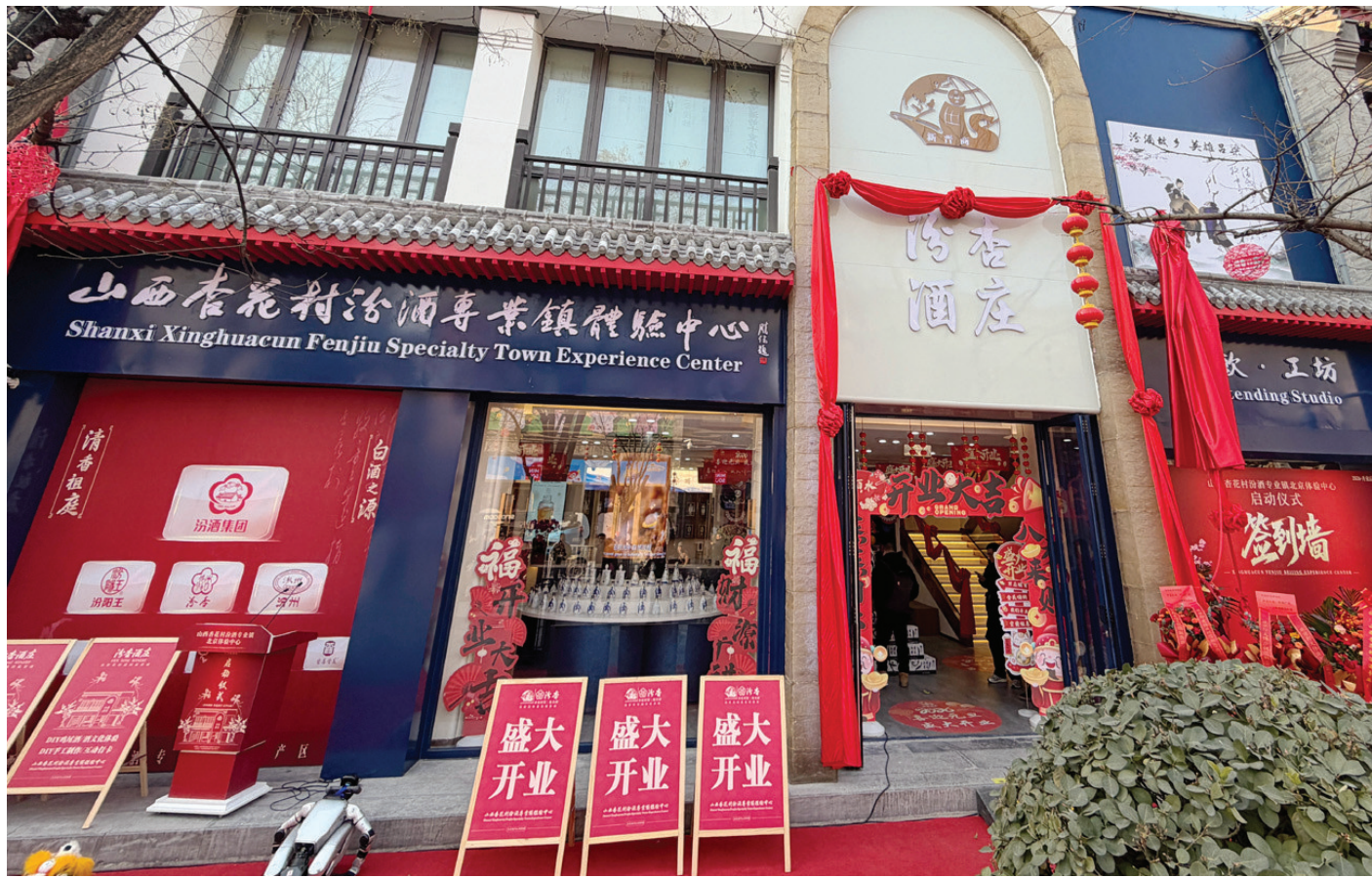
山西杏花村汾酒专业镇体验中心4号店落户北京

于北京，如何领略千里之外的山西风物？答案不在别处，就在一缕被唤醒的千年酒香之中。12月28日，山西杏花村汾酒专业镇体验中心4号店在北京前门大街开门迎客。