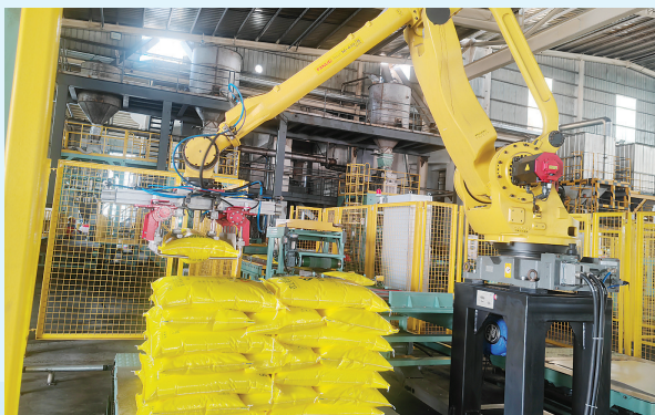
东锦肥业全自动码垛装置正在工作