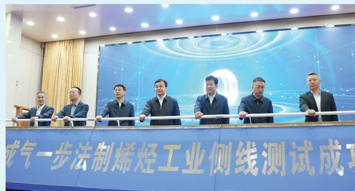
合成气一步法制烯烃技术成果发布