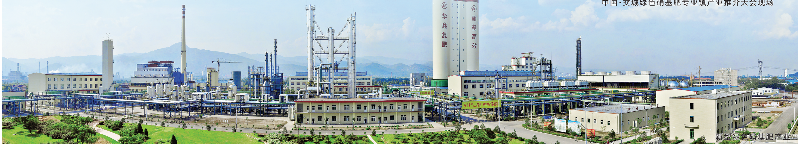
新型绿色硝基肥产业