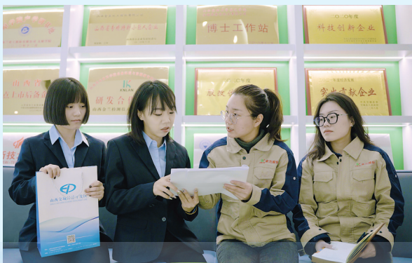
交城县行政审批服务管理局工作人员入企服务