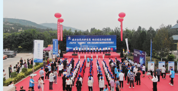
全省首家县级实体科技馆——交城县科技馆开馆