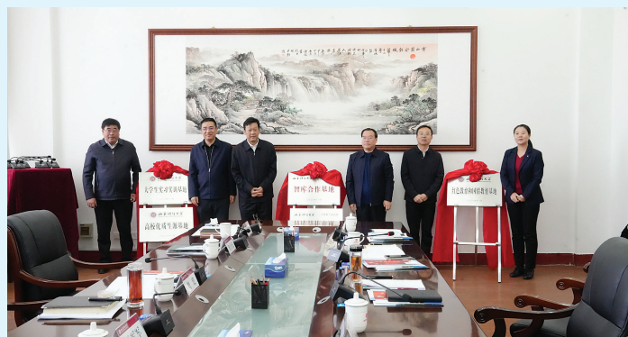
交城县与山西财经大学签署战略合作协议