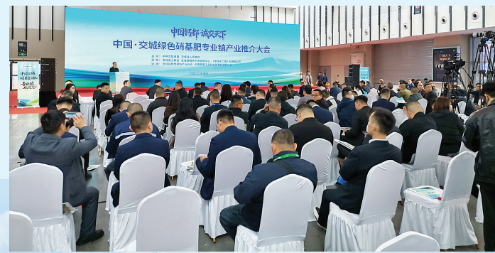
中国·交城绿色硝基肥专业镇产业推介大会现场