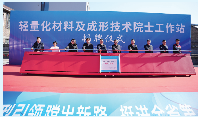
轻量化材料及成形技术院士工作站揭牌