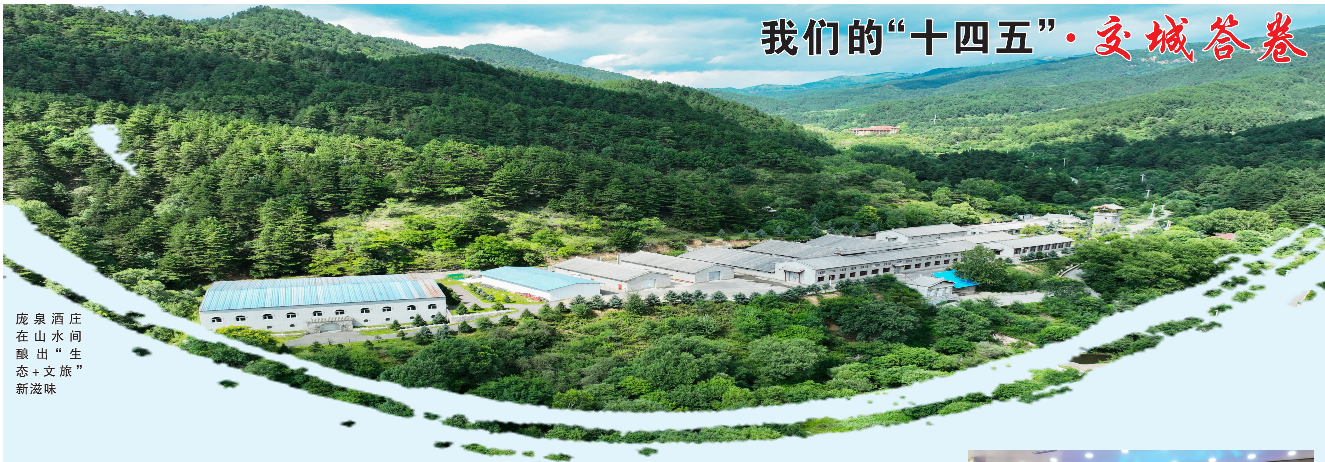
庞泉酒庄在山水间酿出“生态+文旅”新滋味