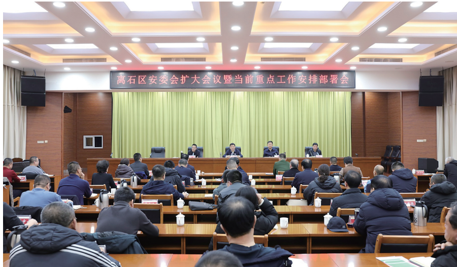
化商圈、活动场地周边餐饮住宿、休闲购物等配套服务,让群众玩得舒心、消费放心;要加大前期宣传造势力度,通过线上线下多渠道、多形式开展立体式宣传,广泛吸引群众关注、调动参与热情,切实营造喜庆祥和、热烈浓厚的新春氛围。

会议研究了离石区2026年春节期间文化活动的安排,强调,春节期间文化活动是丰富群众精神文化生活、营造喜庆祥和新春氛围的重要载体,各级各相关部门要精心策划、周密部署,确保活动有声有色、务实惠民;公安、交警、消防、应急等部门要压实保障责任,提前制定交通管制方案、安全应急预案,加强活动场地消防隐患排查、人流车流疏导和应急值守,筑牢安全防线;要完善停车配套、便民服务等基础设施,优