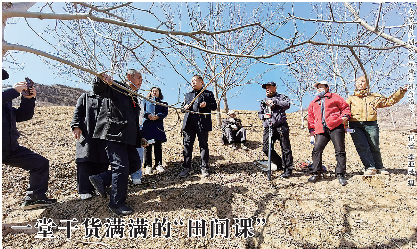
一堂干货满满的“田间课”

为切实护航夏粮丰产，交城县聚焦小麦春管关键环节，组织农技专家深入全县各个乡镇的田间地头，开展“一对一”指导、“面对面”教学，把“科技良方”送到农户家门口，打通农技服务“最后一公里”。该县还将持续深化农技下乡服务，全程跟踪小麦春管情况，及时解决农户生产难题，用科技力量守护每一寸麦田，为全年粮食安全筑牢根基。