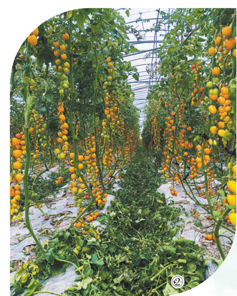
餐桌背后,一些看不见的变化正在悄悄发生。