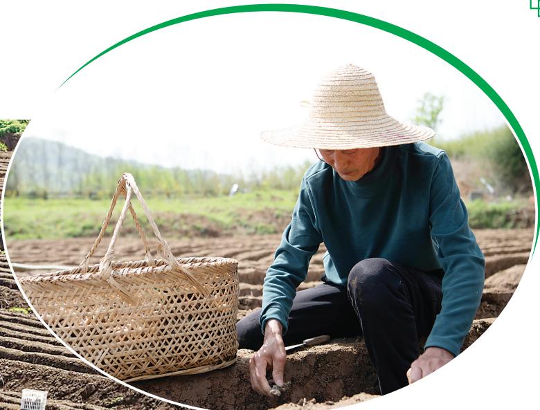
▲4月5日,在安徽省铜陵市郊区大通镇大新村,农民在种植白姜。