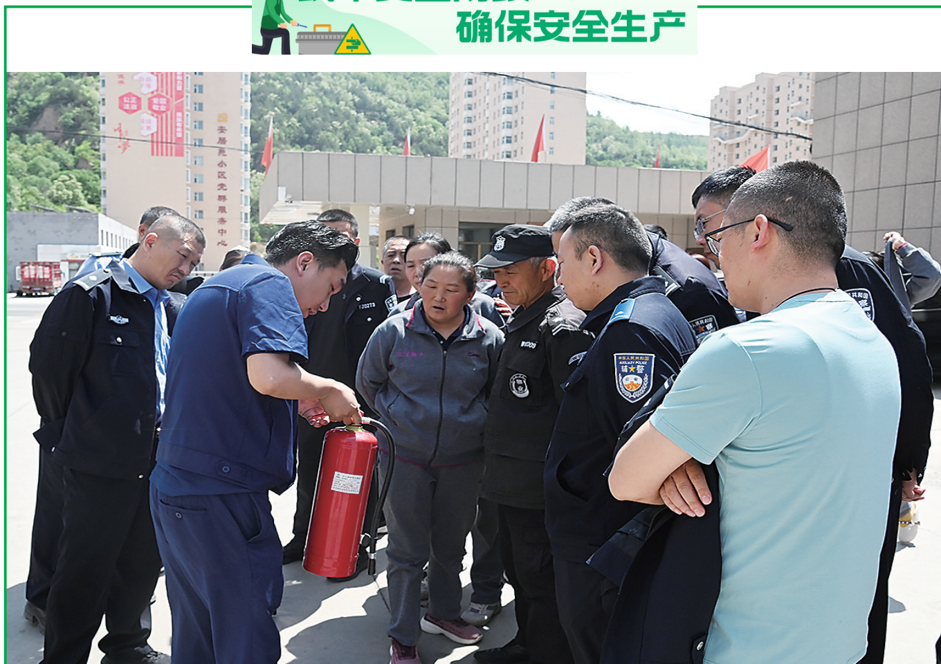
5月15日,方山县消防救援局工作人员深入方山县公安局开展“九小场所”消防安全知识培训工作,并同时开展火灾模拟扑救消防演练工作,有效提升了公安民警的消防执法水平和扑救初期火灾的能力。图为民警正在学习灭火器用法。