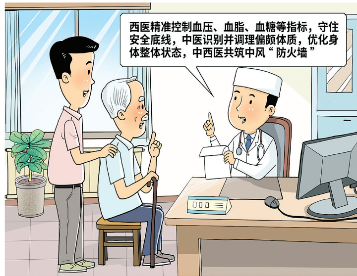
中西医结合防中风 新华社发 朱慧卿 作