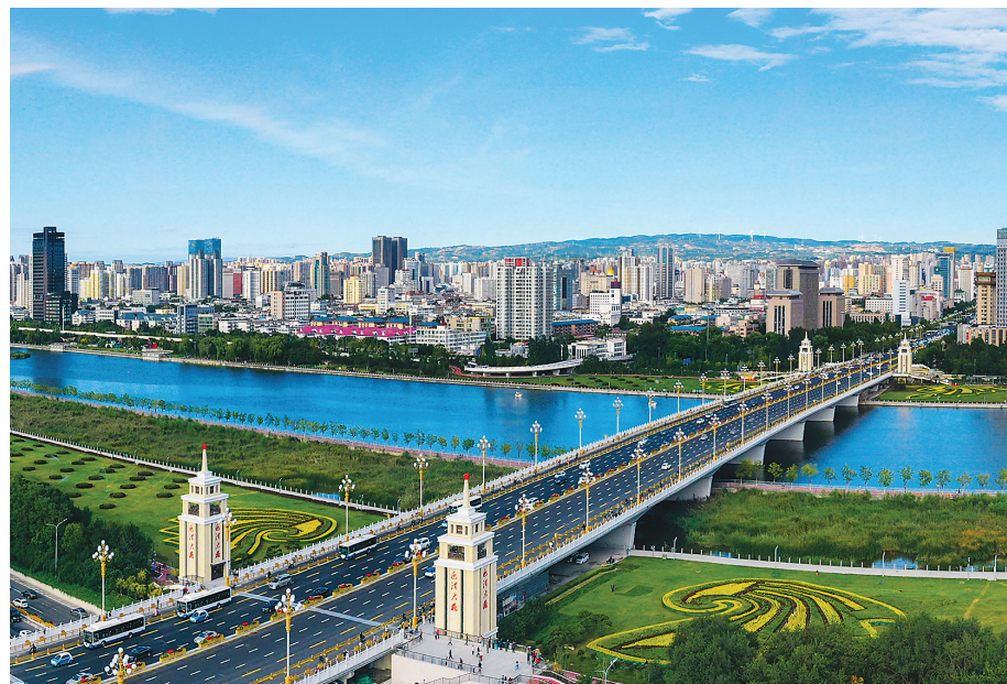
太原市汾河两岸