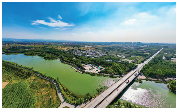
晋中市城区