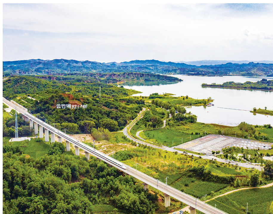
晋中榆社云竹湖