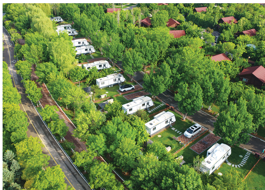
忻州市云中河房车营地

山水不语,绿韵为凭。从汾河之滨到黄河岸畔,从吕梁太行到晋中沃野,中部五市以各自的姿态,奔赴着同一场绿色的约定。(平原)