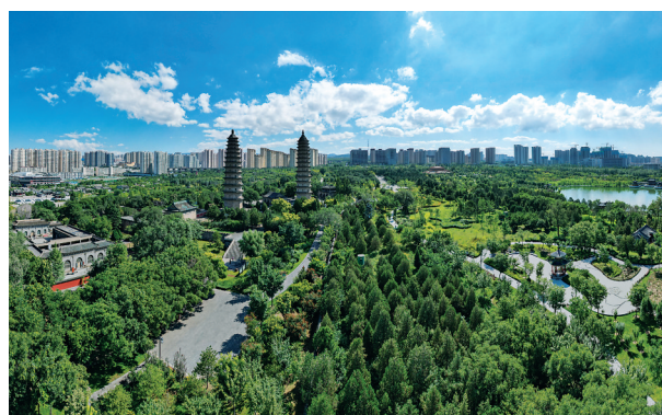
太原市城区