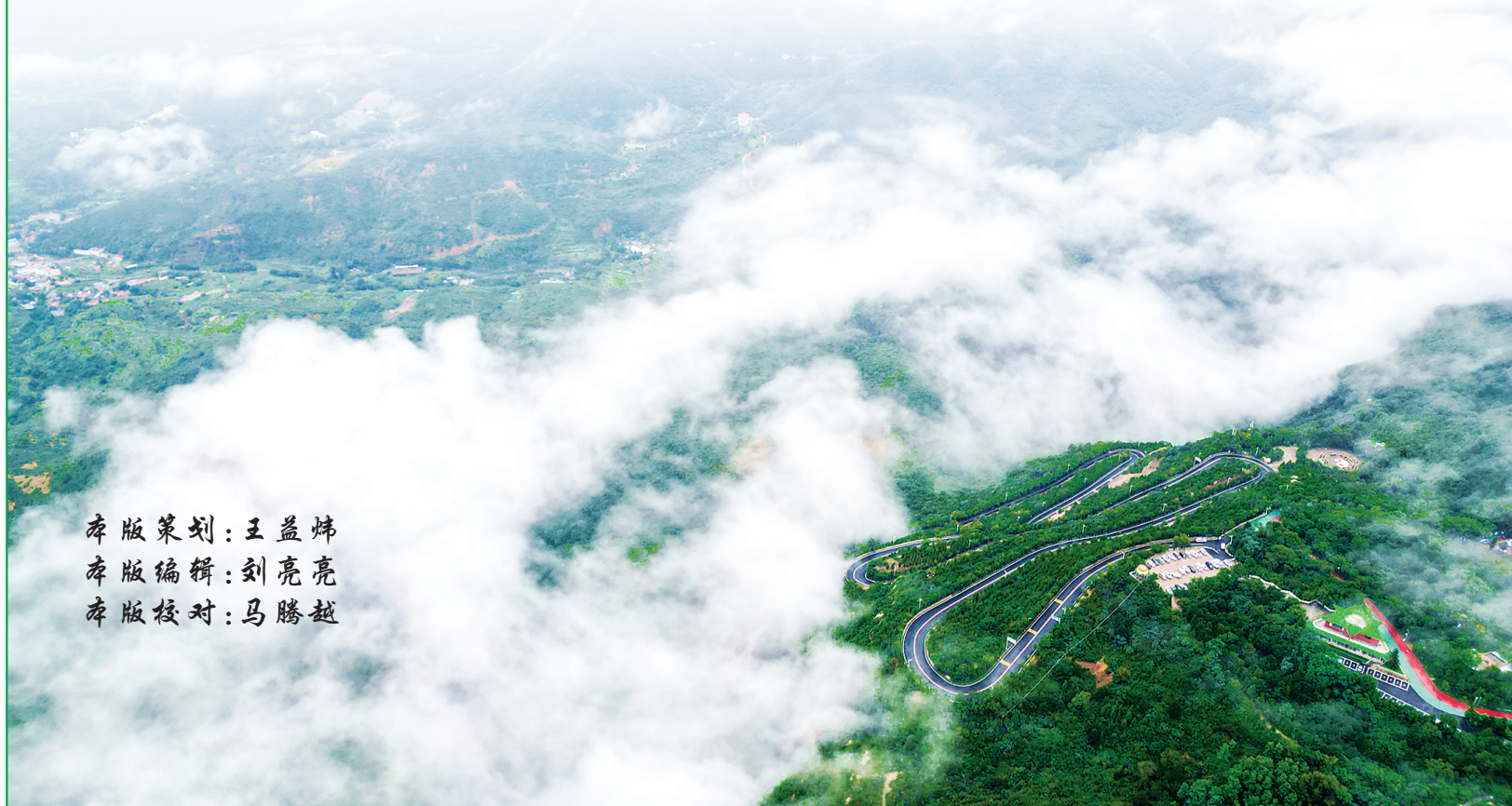
阳泉市狮脑山