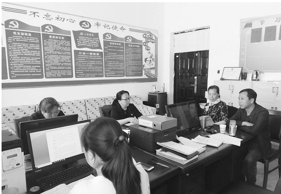
组织机关人员学习业务知识

为保证工作进度，她制定了一套完整的县志编写工作流程机制，力争不走弯路，一步到位：一是由所聘编辑人员与单位直接对接，及时督促指导所涉及单位的县志工作。二是资料收集过程中采取编辑提前介入方式，由各位编辑深入所负责承编单位，协助细化纲目，现场指导，确保收集资料精准。编纂志稿阶段采取初稿编写、讨论修改、送审稿编写同步进行的方式，一周一例会，逐篇讨论。即每周一或周五召开一次编辑例会，梳理问题、解决问题，督促进度。完成一篇初稿，组织集中讨论一