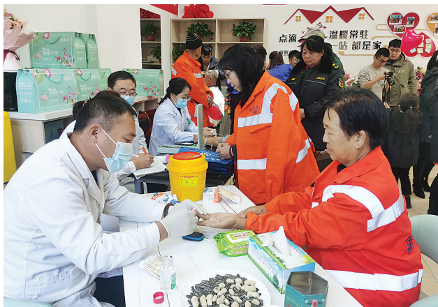
医护人员为环卫工人免费义诊

为了让广大户外劳动者真切感受到爱心驿站的温暖,11月25日上午,离石环卫中心爱心驿站举办“户外很冷、驿站很暖”系列活动,回馈户外劳动者,一起营造“爱”的氛围,开展“爱”的行动,让广大户外劳动者感受到爱与被爱。