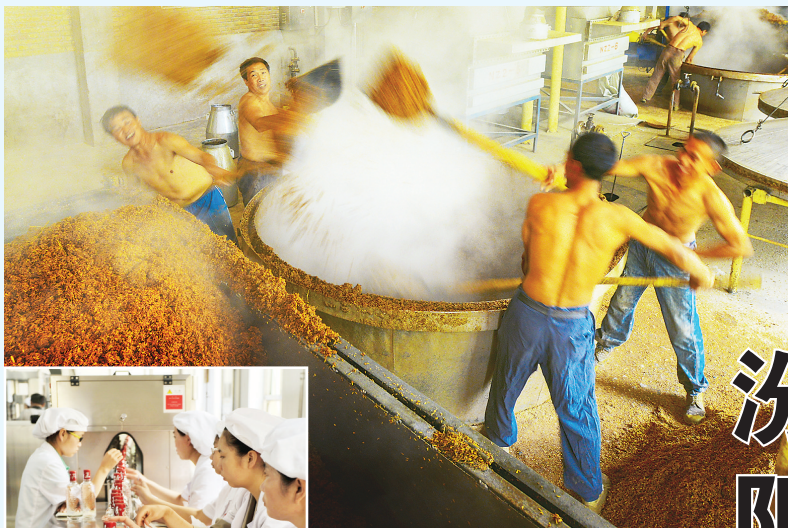
工人正在酿造汾阳王酒

时代在变,越来越多的青年在气象事业浪潮中迎风逐浪、勇挑重担,传承践行着当代气象人“服务人民”的赤子情怀和“精确严谨”的气象精神,我想我也会一直坚守着,坚守初心,坚守岗位,用青春肩负起气象人应有的使命担当,将气象精神发扬光大。