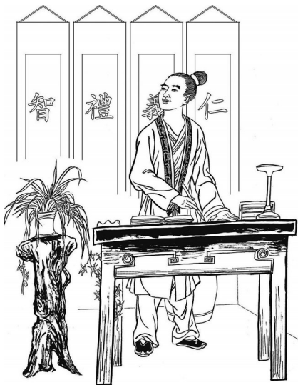
于成龙对父亲说:“经史子集千本万卷,无非仁、义、礼、智、四字而已!”

永宁书院的山长叫邢济堂,也是于成龙的先生。于成龙入学后,不但按时上下学,而且勤奋好学,有爱心、知礼仪,他非常喜欢这个学生。